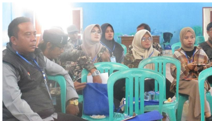
Gambar 4. Antusias Peserta Kegiatan Pelatihan Asosiasi Dosen PkM Indonesia (ADPI)

Sesuai dengan tujuan Pengabdian kepada Masyarakat dengan Skema Program Pengembangan Desa Mitra (PbM-PPDM) Universitas Siliwangi yang berjudul Pelatihan English for Tourism untuk Mendukung Desa Wisata, maka solusi bagi permasalahan yang dihadapi Mitra Kerja, yang pertama adalah dengan melakukan kegiatan pembelajaran tatap muka (luring) dan yang kedua dengan melakukan layanan konsultasi daring, mengingat latar belakang kesibukan para peserta sangat beragam sehingga perlu waktu untuk mengatur pertemuan secara luring.