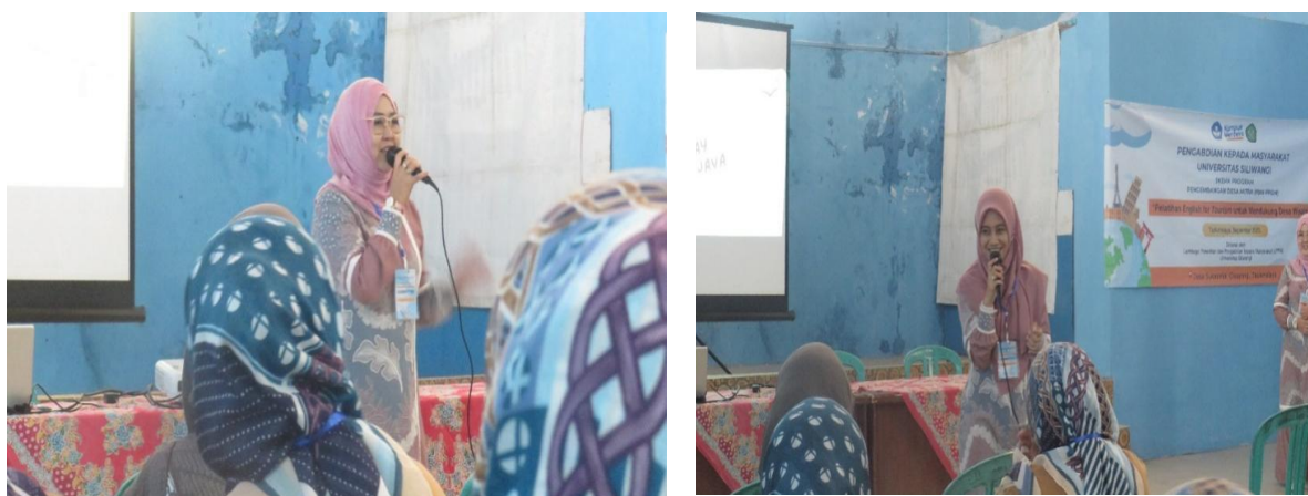
Gambar 2. Proses Pelatihan English for Tourism untuk Mendukung Desa Wisata

Tim PbM-PPDM mempraktikkan silabus sederhana dalam pelaksanaan kegiatan pelatihan English for Tourism dengan cara peserta diberikan penjelasan umum mengenai pembelajaran Bahasa Inggris, materi dasar Bahasa Inggris, materi khusus terkait pariwisata seperti Holiday in West Java, Accomodation, and City Tour , kemudian diberikan pendampingan untuk praktik dan pembelajaran secara terstruktur dan terbimbing terkait materi reading, vocabulary, conversation, intoducing to new person, language focus, dan providing information .