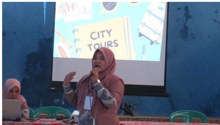
Gambar 3. Pendampingan Peserta Pelatihan oleh Tim PbM-PPDM