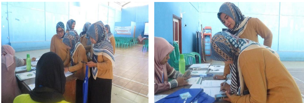
Gambar 1. Pembagian Modul dan Atribut Pelatihan