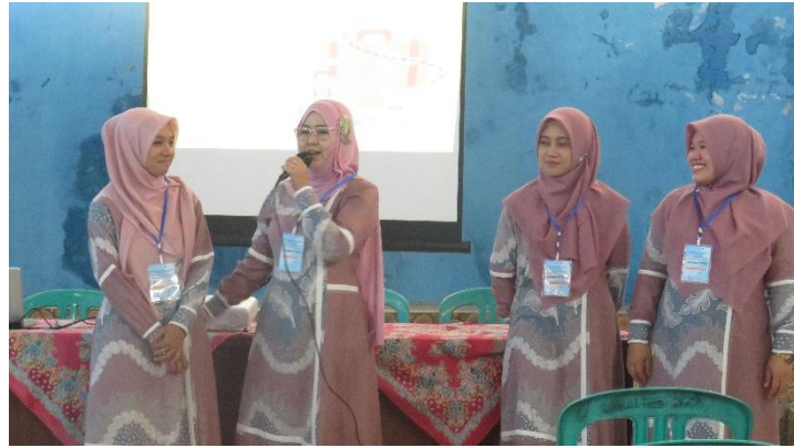
Gambar 5. Pembagian Pendamping Peserta Pelatihan